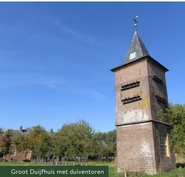
Groot Duijfhuis met duiventoren

In de Middeleeuwen werd hier de Sint-Janskapel gebouwd. Liempdenaren werden hier tot 1860 begraven. Er was lange tijd niets meer te zien. De laatste herinnering verdween in de jaren zeventig van de 20e eeuw, toen een vervallen knekelhuisje werd gesloopt. Nu is deze plek opnieuw ingericht als archeologisch monument en kun je de sporen weer zien.