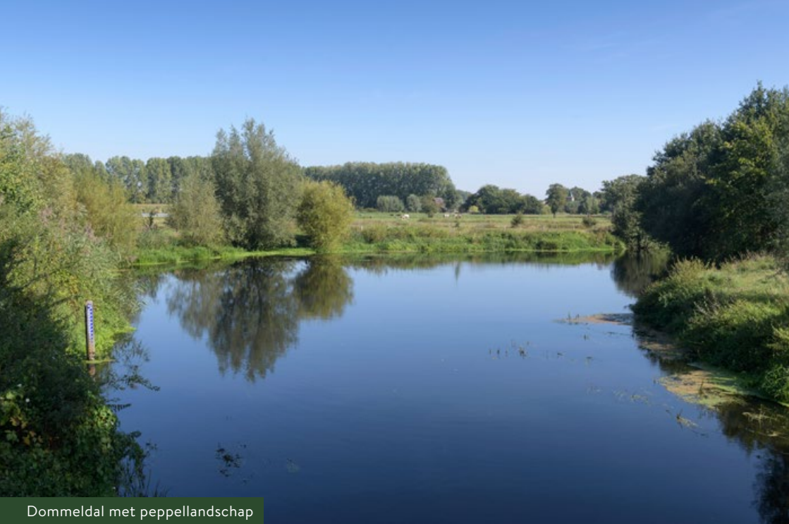
Dommeldal met peppellandschap